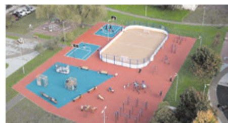
Спортивная площадка на ул. Черкасова