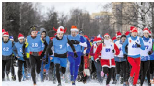
Массовые спортивные мероприятия

1500 жителей района приступили к выполнению нормативов ГТО в 2022/2023 году