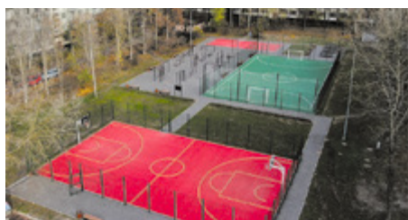
Спортивная площадка на Северном пр.

7 новых спортивных площадок отремонтируют и обустроят в районе в ближайшие три года