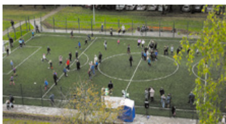
Мини-футбольное поле на пр. Культуры