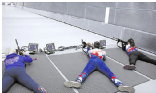
Тир в СШОР № 3

3500 жителей района вовлечены в занятия с инструкторами по месту жительства