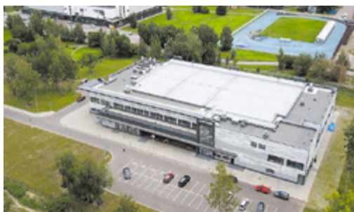
Ледовая арена на ул. Фаворского