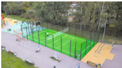
Спортивная площадка на ул. Ушинского